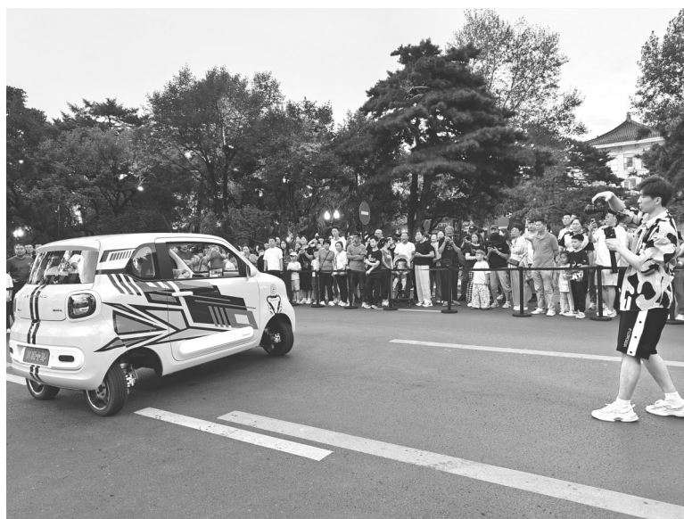
奔腾小马原地转向表演