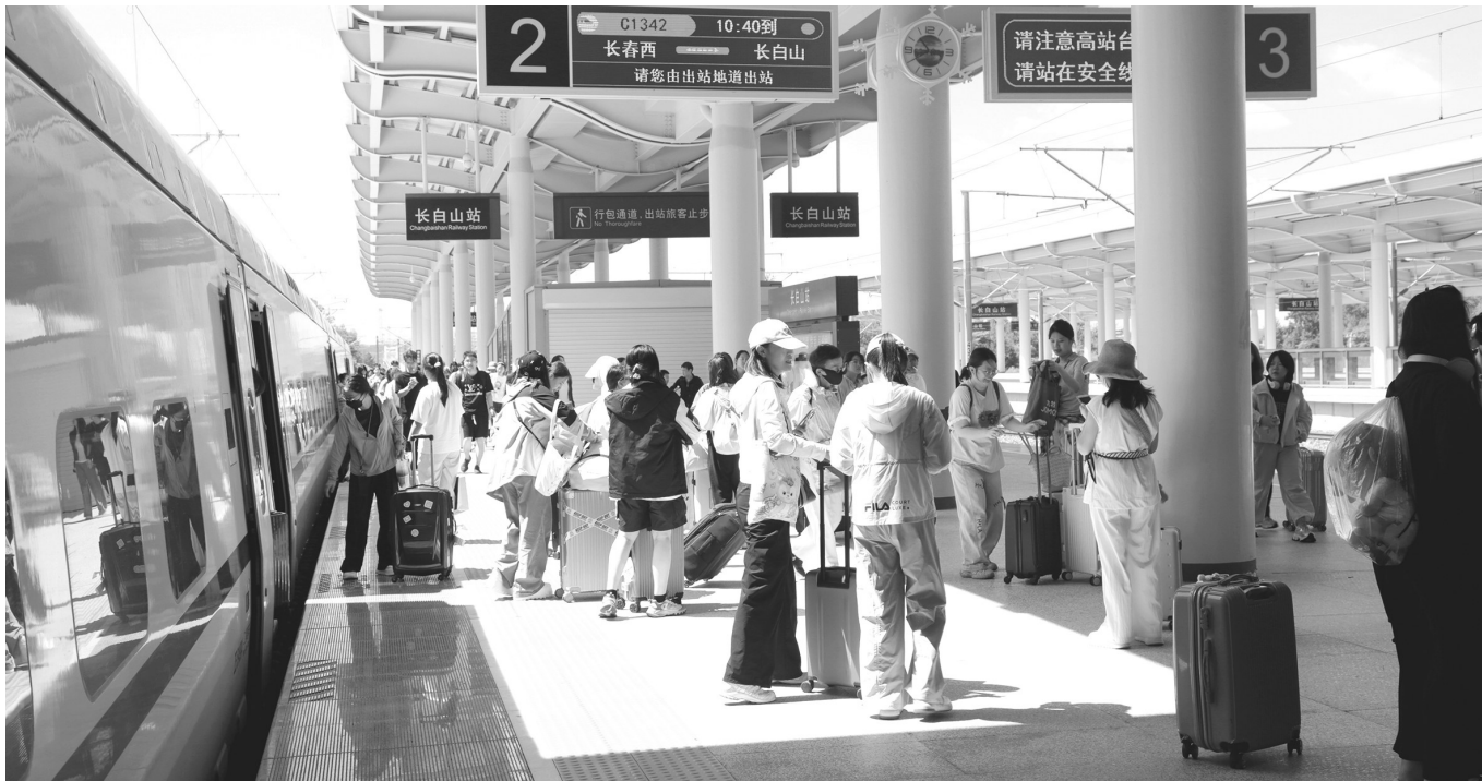
书粉赴约长白山

“在扩充运力的基础上,我们将视角更多地放在服务旅客出游第一公里和最后一公里上,加密长春龙嘉机场至长白山高铁开