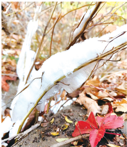
冰雪做伴,秋叶回归大地