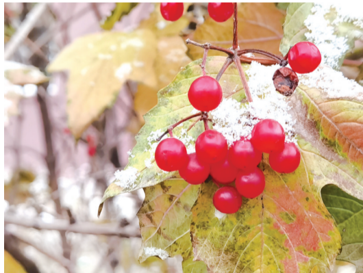
冰霜笼罩的红果

初雪一般不大,像春风吹起柳絮,温柔而有诗意。落雪无声,美梦无痕。纯净的白色中,枝头上亮晶晶的,像雪又像冰,玉枝垂挂,玲珑多姿,使人目不暇接,更让人陶醉得流连忘返。