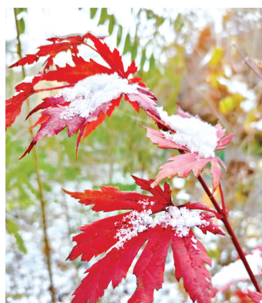
霜叶红于二月花