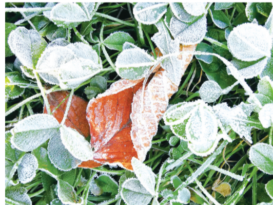
冰霜与秋叶,宛如一幅油画