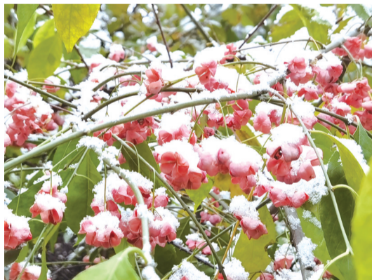
银色冰雪下的一抹粉红