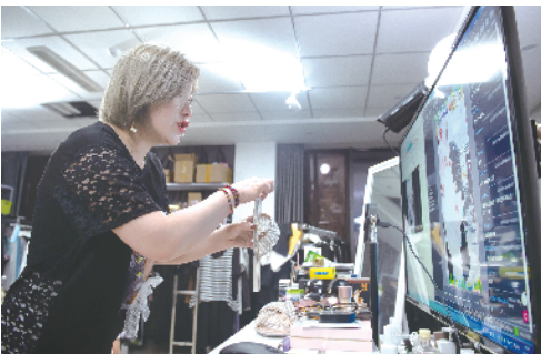
向粉丝介绍一款鞋的优点

两年零四个月时间,她只停播一天 参加新晋主播排位赛连续直播22小时 最多的一次直播展示了197件衣服和裤子,脱穿近400次