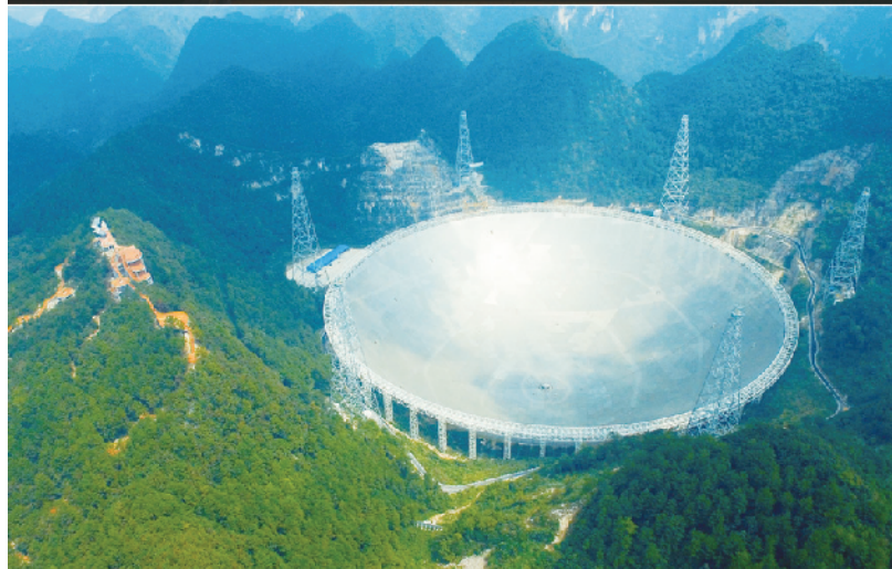
被誉为“中国天眼”的500米口径球面射电望远镜(FAST)经过1年调试,已实现指向、跟踪、漂移扫描等多种观测模式的顺利运行,并确认了多颗新发现脉冲星。这是我国天文望远镜首次发现脉冲星。上图为FAST工程副总工程师李□在介绍脉冲星发现过程;下图为群山中的FAST工程