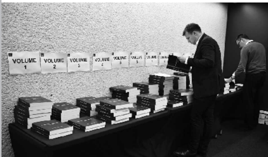
6日,在英国伦敦,记者翻阅海量的英国有关介入伊拉克战争的调查报告

2003年,布莱尔以伊拉克拥有大规模杀伤性武器将给英国带来威胁为由,劝说议会同意英国参与对伊战争,然而英美事后并没有在伊拉克发现任何大规模杀伤性武器。